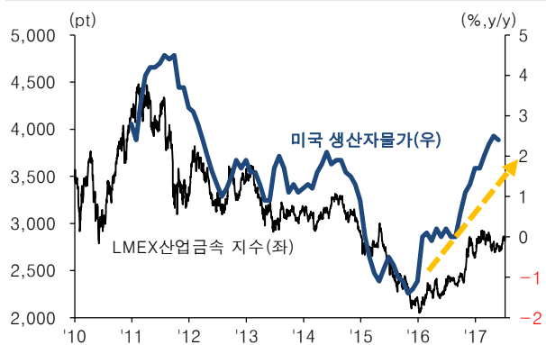
산업금속 가격 상승으로 미국 생산자물가 상승 지속될 것